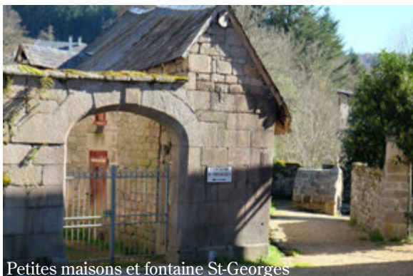
Petites maisons et fontaine St-Georges

10h, 11h, 14h, 15h, 16h, 17h : visites commentées de l'église (ASET) et du bourg (ARHA)