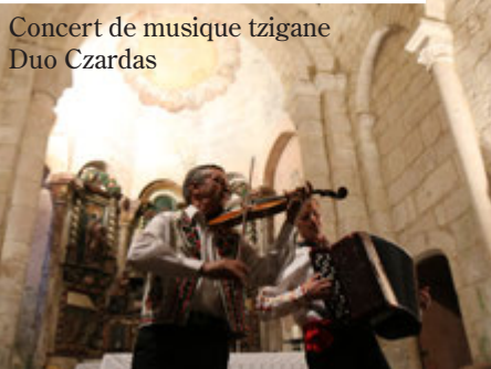
Concert de musique tzigane Duo Czardas