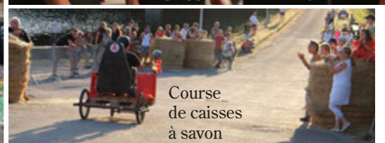
Course de caisses à savon