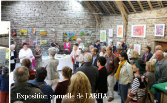
Exposition annuelle de l'ARHA