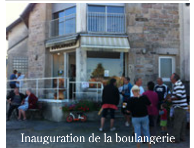
Inauguration de la boulangerie