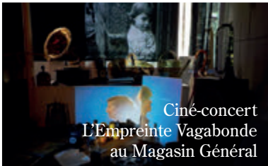
Ciné-concert L'Empreinte Vagabonde au Magasin Général