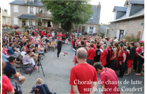
Chorales de chants de lutte sur la place du Coudert