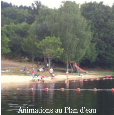
Animations au Plan d'eau