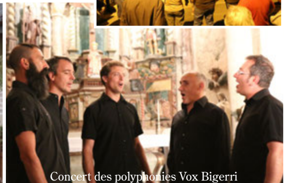
Concert des polyphonies Vox Bigerri