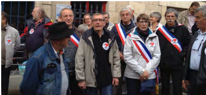
Rassemblement à Tulle pour la défense de nos communes

Le Conseil Municipal de Tarnac a pris position le 16 octobre sur le projet de Nouveau Schéma Départemental de Coopération Intercommunale