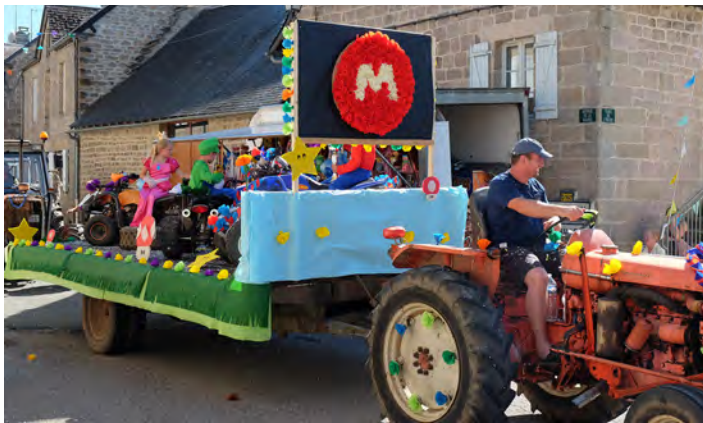
Fête de la Saint-Gilles