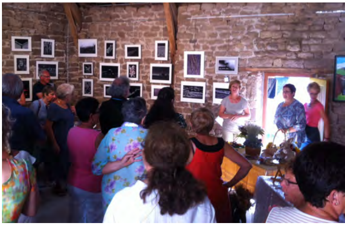
Vernissage de l'exposition de l'ARHA