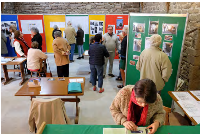
Journées du Patrimoine