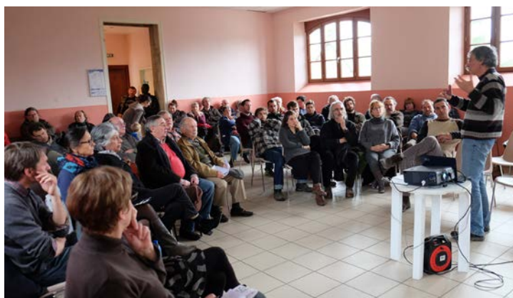
Assemblée communale du 2 avril 2016

Concernant les investissements , nous réalisons, là aussi, un excédent qui s'élève à 376 607€ (1 721 817€ de recettes, 1 345 209€ de dépenses) alors que la garderie, la cour et les sanitaires de l'école ont été rénovés, l'atelier communal racheté, la chaudière de l'école comme les fenêtres des logements changées, la route de Larpé goudronnée et le chantier de l'église poursuivi.