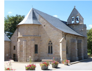
Édifice roman, avec une extension gothique de la fin du XIV e siècle.