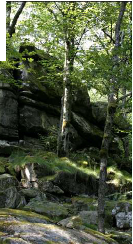
Rochers de Servières

Boucle de 13 km / Difficulté moyenne / Balisage : PR Jaune Départ et arrivée place de l'Église, à Tarnac / Parking : derrière l'église Liens Web : http://www.pnr-millevalches.fr/rando-millevalches et https://arha-limousin.com/