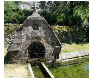
Autrefois abreuvoir et lavoir.