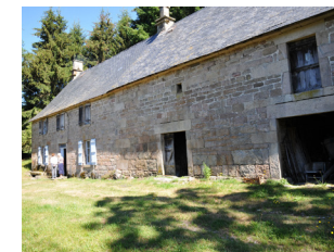
Ferme du XIX e siècle, de type grange auvergnate.

À droite : château construit à partir de 1609 par la famille Beupoil de Saint-Aulaire ; il fut vendu aux Lagrange, bourgeois anoblis d'Eymoutiers.