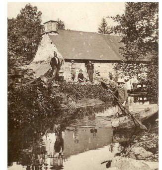
En activité jusqu'en 1956, aujourd'hui en ruines.