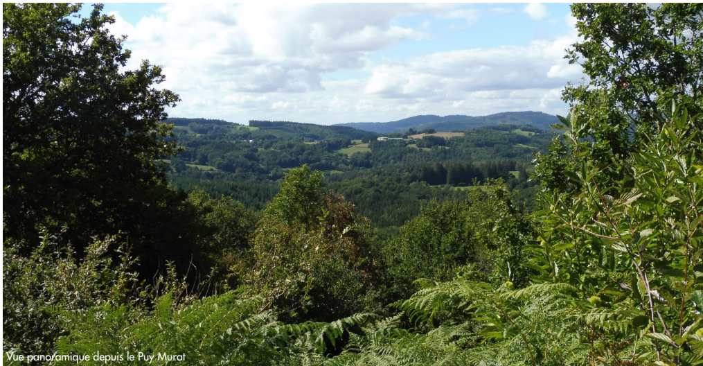
Vue panoramique depuis le Puy Murat