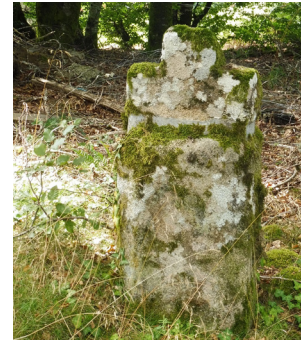
Croix de carrefour du XVIII e siècle.