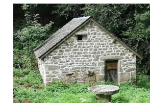
Moulin du XVIII e siècle restauré.