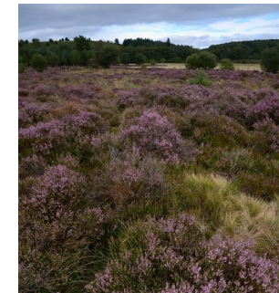
Lande de bruyères