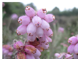
Bruyère à quatre angles