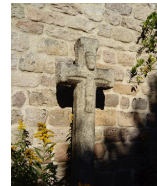
Croix pattée en granit, ancienne croix de carrefour