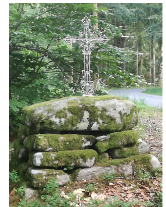
Croix en fer